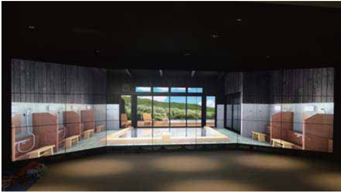
3DCGで等身大の完成イメージを 疑似体験できる『バーチャル』