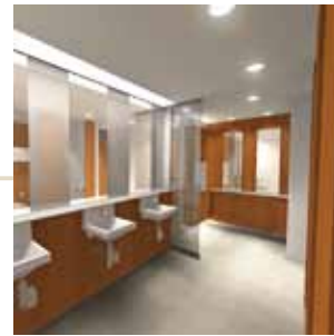
バーチャルルームによる空間のシミュレーション